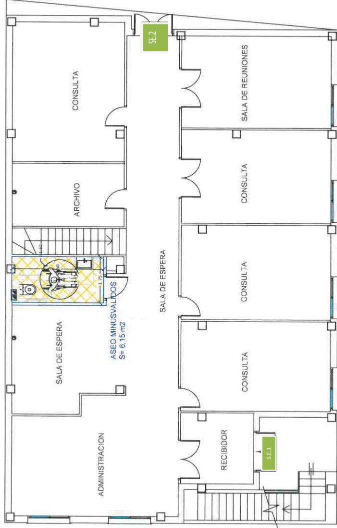
PLANTA PRIMERA- ALBAÑILERIA E= 1/100