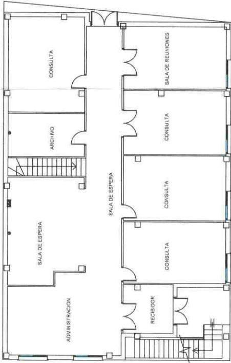
PLANTA PRIMERA- estado actual E= 1/150